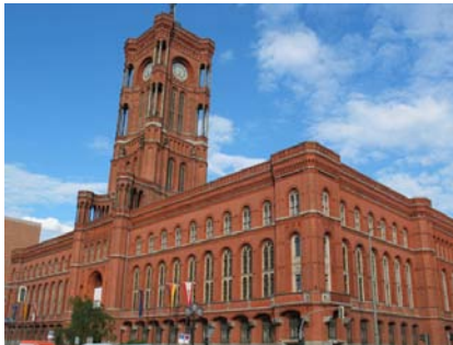
Rotes Rathaus Berlin Rathausstraße 15, 10178 Berlin

Das Rote Rathaus, Sitz des Regierenden Bürgermeisters von Berlin, ist eines der bekanntesten Wahrzeichen der Hauptstadt. In diesem beeindruckenden Ambiente findet die 2010 European Local Government Conference statt.